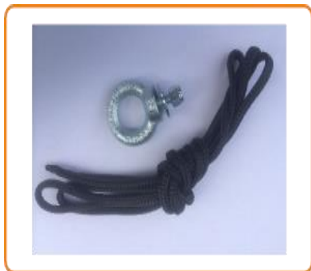
WT92B Cordelette de soutien au mur du couvercle du pédiluve Footcheck